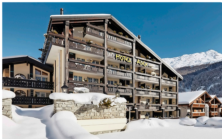
Das Resort Hotel Alex im Chalet-Stil ist eine Zermatter Institution.