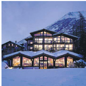
Wellness der Spitzenklasse bietet das Hotel Pirmin Zurbruggen.

1. (Vorjahr 4) Wellnesshotel Pirmin Zurbruggen, Saas-Almagell Erstmals auch im Sommer ausgebucht. Hotelbüro mit Magnetwirkung. DZ ab 290 Fr., Tel. 027 957 23 01 www.zurbruggen.ch