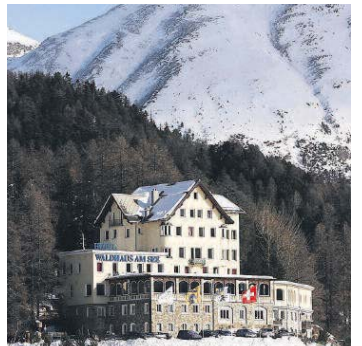
Seit fünfzehn Jahren Klassenbeste: Das Waldhaus am See.

1. (Vorjahr 1) Waldhaus am See, St. Moritz Claudio Bernasconi Kulthotel blüht wie nie. Eine einzige Erfolgsstory. DZ ab 310 Fr., Tel. 081 836 60 00 www.waldhaus-am-see.ch