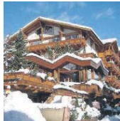
Das Ferienresort & Spa Saas Fee.

15. (neu) Ferienart Resort & Spa, Saas-Fee Im Riesenschiff dreht sich das (fast) alle ums Wallis. Mit vollem Erfolg. DZ ab 626 Fr., Tel. 027 958 19 00 www.ferienart.ch