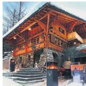
Das Kleindorf Cervo in Zermatt.

13. (14) Alpenhof, Zermatt Neue Smoking Lounge, umgebaute Restaurants. Ein Tophaus für Genieser. DZ ab 596 Fr., Tel. 027 966 55 55 www.alpenhofhotel.com