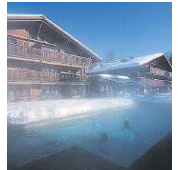
Alpine Lodge in Saanen-Gstaad.

15. (neu) Alpine Lodge, Saanen-Gstaad Trendiges Designhotel mit Themenzimmern. Paradies auch für Computertreks. DZ ab 380 Fr., Tel. 033 748 41 51 www.alpine lodge.ch